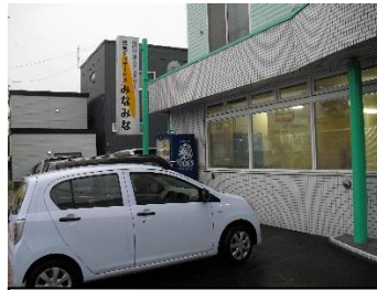
遊 ing ロードと駅前通りの交差点の近くです！

『みなみな』はアイヌ語のニコニコ笑うという意味で、みんながいつも笑顔で遊び、学ぶことができればという思いが入っているそうです。『みなみな』は、小学生から高校生までの子どもたちが放課後や学校が休みの時に学んだり、遊んだりすることのできる事業所です。活動内容は、曜日ごとに決まっています、体を動かすプログラムや個別課題、作業活動のプログラムがあります。