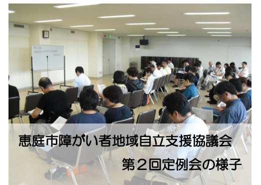
恵庭市障がい者地域自立支援協議会 第2回定例会の様子

「いい街づくりのため、誰でもふらっと立ち寄れる場所」を目指して頑張りますのでこれからもよろしくお願ひします！