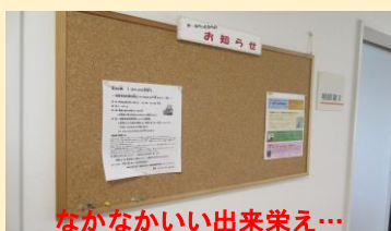
なかなかいい出来栄え...

出来るだけ新しい情報や大切な情報をお伝えしていこうと考えていますので、e-ふらっとにお立ち寄りの際は、ぜひチェックしてみてください。もちろん、「お知らせをチェックする」という目的で、お越しいただいてももちろん構いません。初めは手探りでスタートになると思いますが、みなさんも何か気づいたことなどがあれば、お気軽にご意見をお寄せくださいね☆