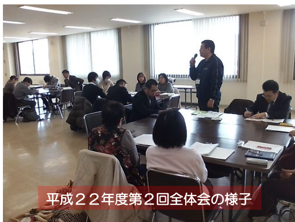
平成22年度第2回全体会の様子

e-ふらっとが事務局を担当する恵庭市障がい者地域自立支援協議会は6月に開催される第1回全体会から今年度の活動をスタートします。今年も部会を中心に活動していく予定です。