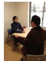
相談室の中の様子