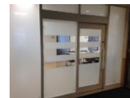
e-ふらっとの入り口